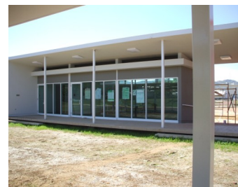
ÁREA TÉCNICA Y DOPAJE