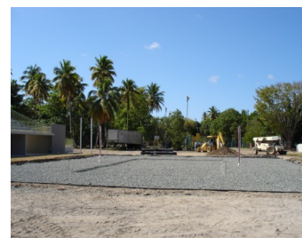
CANCHAS EN ARENA