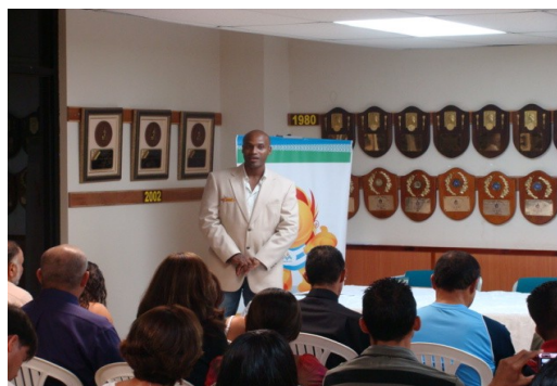
DELEGADO IAF DIRIGIÉNDOSE A LOS GRADUANDOS