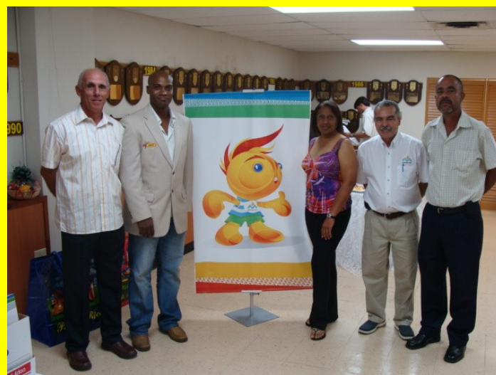
INSTRUCTORES FEDERACIÓN INTERNACIONAL DE ATLETISMO CURSO PARA JUECES