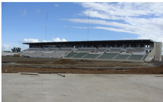
Estadio Centroamericano (Atletismo—Fútbol)

Ningún otro deporte se identifica más con el espíritu olímpico que el atletismo. La primera prueba disputada en los Juegos Olímpicos de la Antigüedad fue una carrera de aproximadamente 192 metros. Por esa razón, en la mayoría de los intentos de revivir los Juegos Olímpicos en el siglo XIX sólo se realizaron competiciones de atletismo. Desde el año 776 A.C. existen registros de disputas para ver quién es el más rápido, quién salta más lejos o más alto, o quién lanza a una distancia mayor. En los Juegos Modernos, el atletismo se desdobló en pruebas de pista (velocidad, distancias medias y largas, relevos, vallas y obstáculos), de saltos ( largo, altura, triple y garrocha), de lanzamientos (bala, disco, jabalina y martillo), de calle (maratones y marchas) y combinadas (pentatlón y decatión).