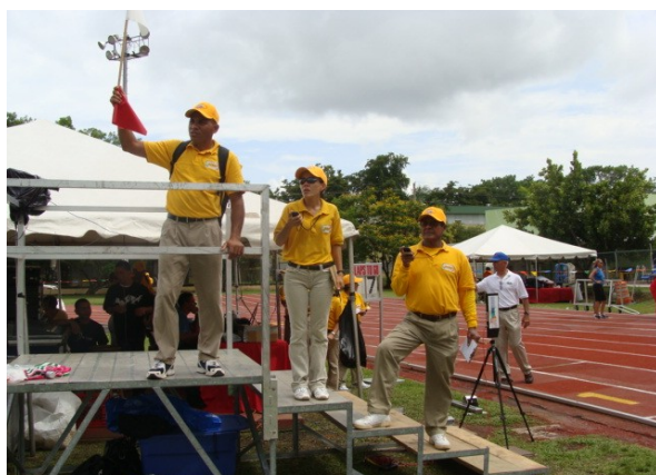
CURSO DE JUECES ATLETISMO COMPETENCIA DE PRÁCTICA EN CAROLINA

Al 1ro de JULIO de 2009 Faltan 380 días para los JUEGOS MAYAGÜEZ 2010 Los esperamos en Mayagüez Del 17 de Julio al 1ro de Agosto de 2010