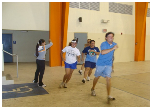
PRÁCTICA DE LA MARCHA