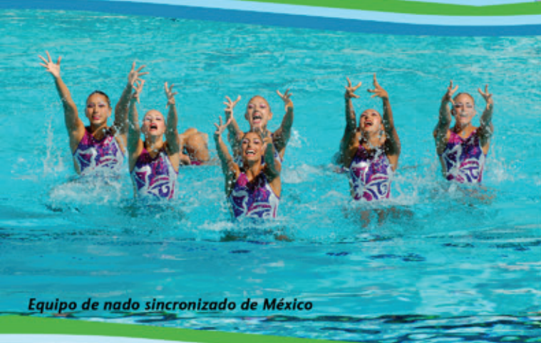
Equipo de nado sincronizado de México