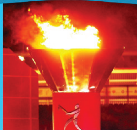
La llama se traslada a Veracruz.

La ceremonia de clausura tiene una duración de dos horas, concluyendo a las 7:30 pm. En el Parque Litoral continúa el cierre de la Fiesta Centroamericana hasta las 12:00 de la madrugada, informó Pérez Grajales.